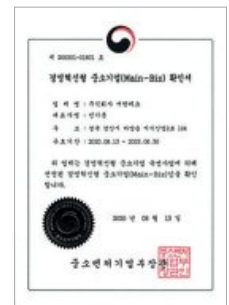
경영혁신형(Main-Biz) 중소기업 선정 Certificate of MAIN-BIZ