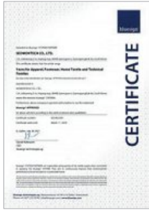
블루사인 인증서 획득 BLUESIGN Certificate