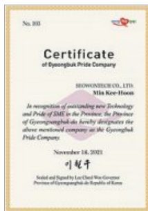
경북 프라이드기업 선정 Certificate of Gyeongbuk Pride Enterprise