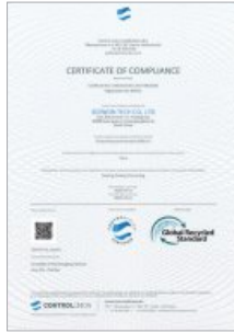
GRS 인증서 획득 GRS Certificate