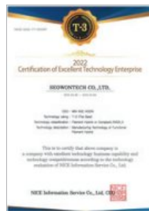
2022 기술평가 우수기업 선정 Certificate of Excellent Technology Enterprise