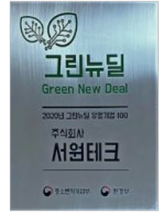
그린뉴딜 유망기업 선정 Green New Deal Prospective Company