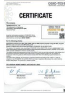
친환경 OEKO-TEX 인증서 획득 OEKO-TEX Recycle Certificate