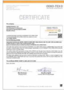
OEKO-TEX 인증서 획득 OEKO-TEX Standard 100 Certificate