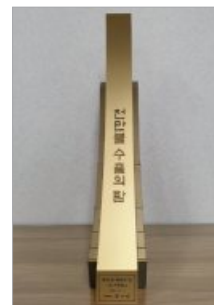
천만불 수출의 탑 수상 A tower of 10 million dollar in exports