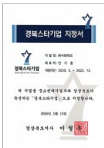
경북스타기업 선정 Gyeongbuk star Enterprise